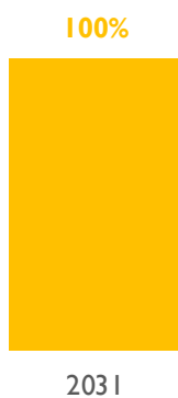
Permanência Garantida por ABL