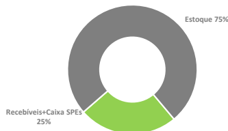
Valor a receber por status

Obtivemos durante o último ano grande volume convertido caixa nas spes investidas, reduzindo assim o volume em estoque na proporção do fluxo projeto a receber pelo fundo, este caixa convertido nas SPEs deverá ser distribuído ao fundo nos próximos meses. Referente aos estoques, atual 95% do estoque, dos projetos onde o fundo detém participação está concentrado em 1 projeto, onde o gestor do FII continua em negociação com os incorporadores para liquidação do projeto.