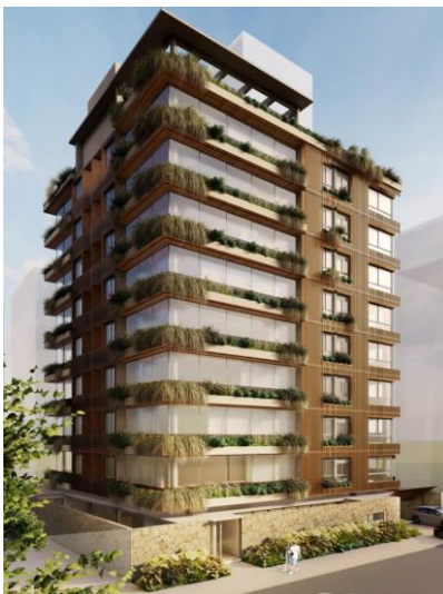
Perspectiva preliminar da fachada do empreendimento