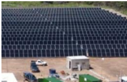
Figura 2 - - Imagem frontal da UFV Mombaça

O contrato de locação do empreendimento imobiliário está em fase final de negociação e a expectativa é que a operação do ativo se inicie ainda no mês de dezembro deste ano.