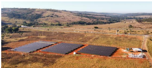
Figura 1 - Imagem aérea da UFV Alexânia

O locador do empreendimento é a Associação Yellot, comandada pela empresa de mesmo nome, que une consumidores de baixa tensão residenciais e comerciais de diferentes perfis.