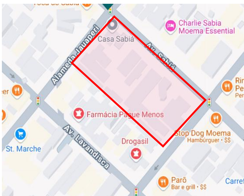
Imagem 1 – Localização do terreno

O terreno, no quadrilátero entre Av. Sabiá, Alameda dos Arapanés e Alameda Jauaperi, conforme imagem 1 abaixo, está localizado em um bairro considerado nobre da cidade de São Paulo, conhecido como “Moema Pássaros”. Tal região conta com uma variedade de serviços de qualidade, diversos restaurantes, proximidade de localidades importantes como o Aeroporto de Congonhas e fácil acesso ao Expo Imigrantes e principais avenidas da cidade, como Av. Bandeirantes, Av. Washington Luís e Av. 23 de Maio, conforme imagem 2.