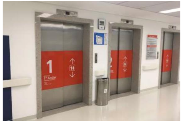
Hall dos Elevadores