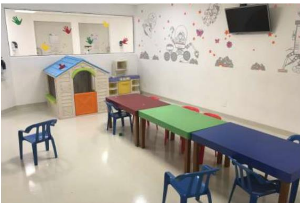
Espaço para Recreação Infantil