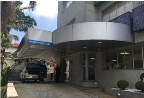
Acesso ao Hospital