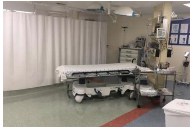
Área interna da UTI