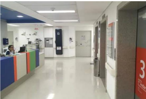
Área interna do Hospital