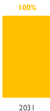
Permanência Garantida por ABL