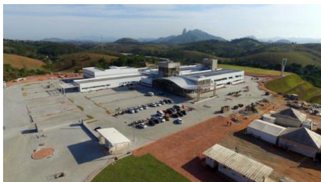
Execução do paisagismo, pavimentação e muretas externas

O relatório fotográfico contendo as principais modificações na obra no mês de outubro de 2019: