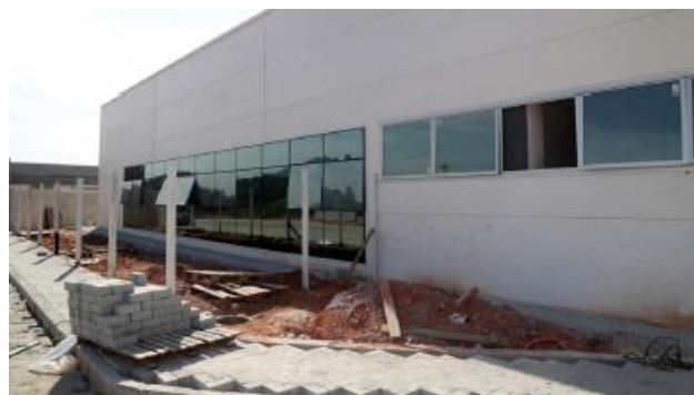
Finalização da instalação do sistema pele de vidro da UTI