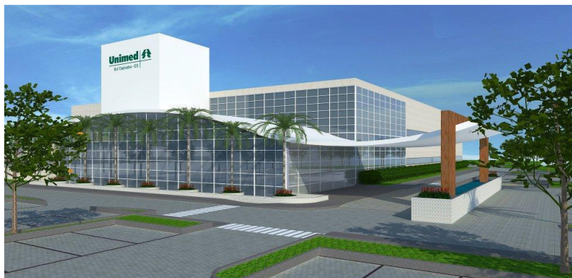
REPRESENTAÇÃO GRÁFICA DO PROJETO

Toda a infraestrutura acessória (cabearno elétrico, sistema de água e esgoto, acesso rodoviário e adaptações para o transporte público) ocorrerão por conta da Unimed Sul Capixaba.