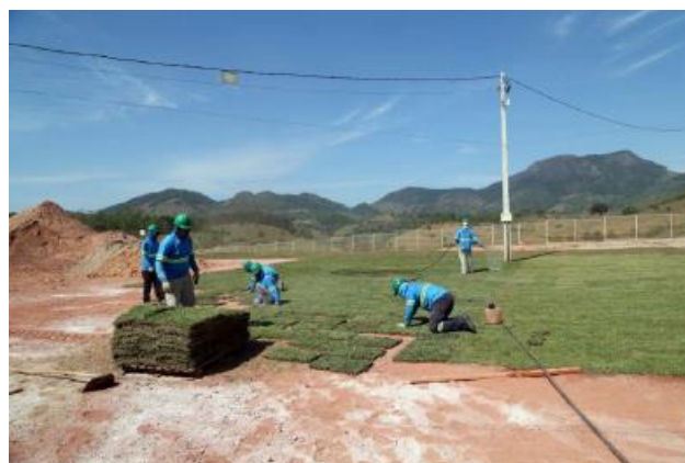
Início do paisagismo externo