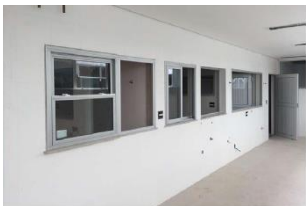
Instalação de guichês e visores (CME, UTI e Centro Cirúrgico)