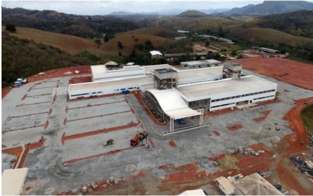
Assentamento do PAVI-S e muretas externas

O relatório fotográfico contendo as principais modificações na obra no mês de setembro de 2019: