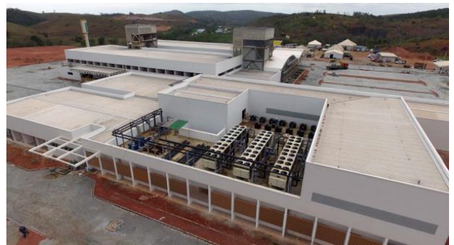
Montagem da Central de Água Gelada (CAG) do ar condicionado