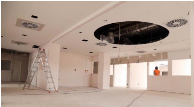
Fechamento de forro (CME, UTI e Centro Cirúrgico)