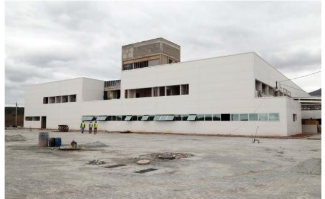
Instalação das esquadrias e vidros (Boco 01)