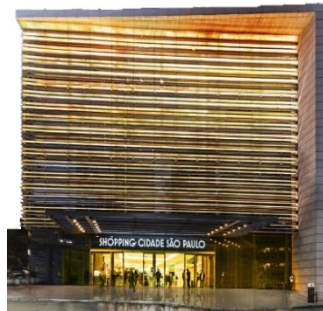
Shopping Cidade São Paulo