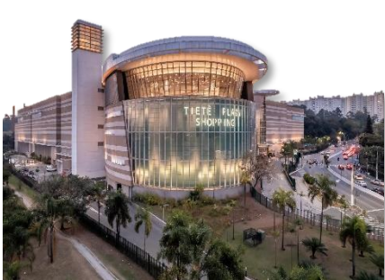
Tietê Plaza Shopping