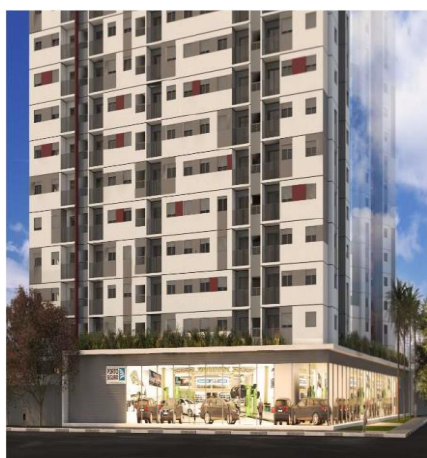
Perspectiva Fachada Antônio Gil