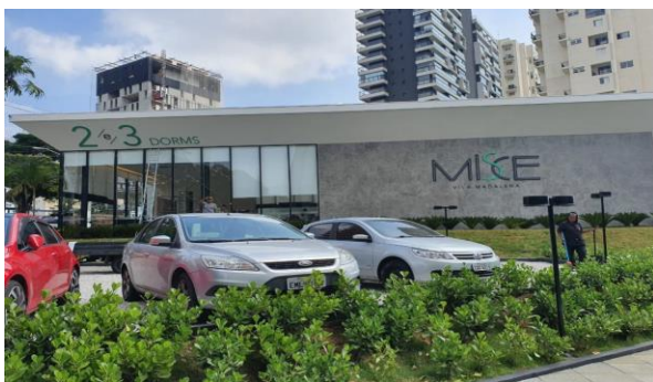
Fachada Stand de Vendas