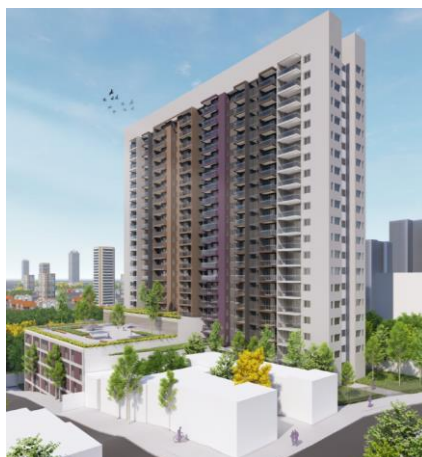
Perspectiva Fachada Major Freire