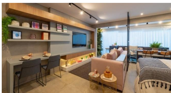
Apartamento decorado de 24m 2