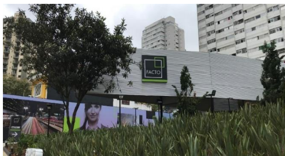
Fachada do Stand