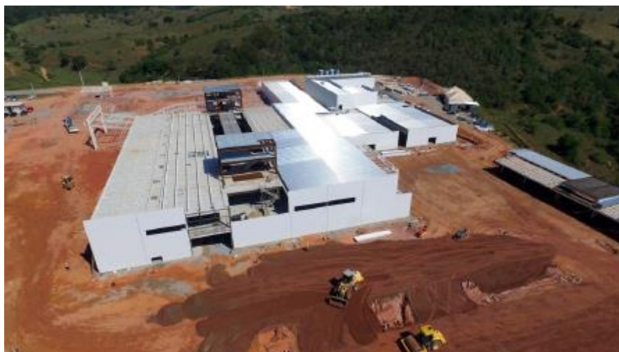
Montagem da fachada com painel termoacústico