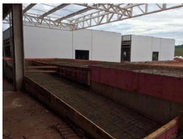
Execução da armação das lajes da doca