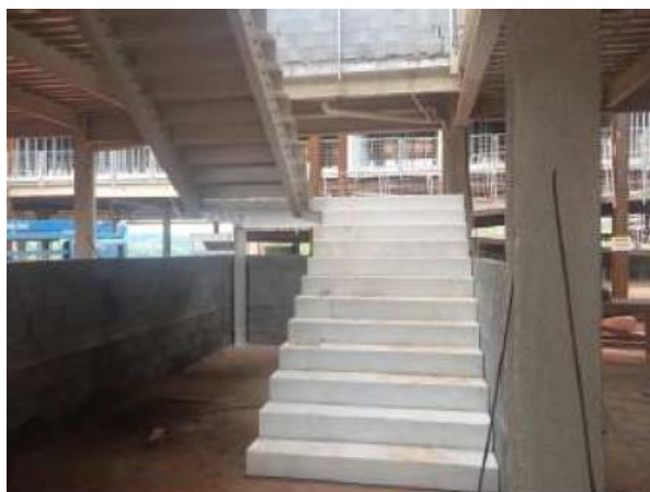
Montagem das escadas em estrutura metálica

O relatório fotográfico contendo as principais modificações na obra no mês de dezembro de 2018: