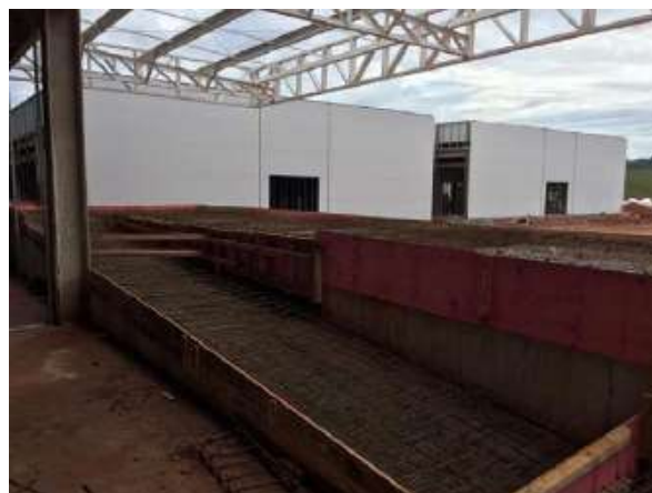
Execução da armação das lajes da doca