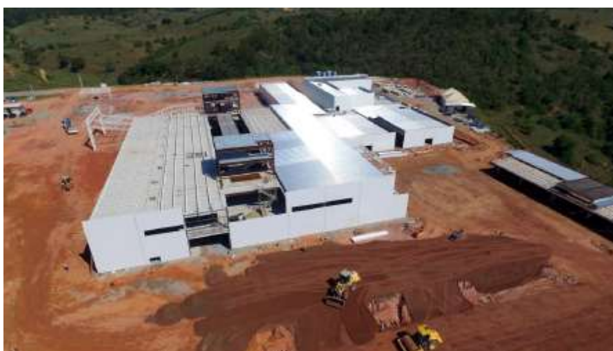
Montagem da fachada com painel termoacústico