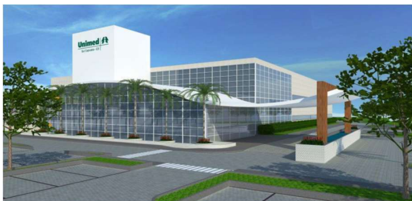
REPRESENTAÇÃO GRÁFICA DO PROJETO

Toda a infraestrutura acessória (cabramento elétrico, sistema de água e esgotamento, acesso rodoviário e adaptações para o transporte público) ocorrerão por conta da Unimed Sul Capixaba.