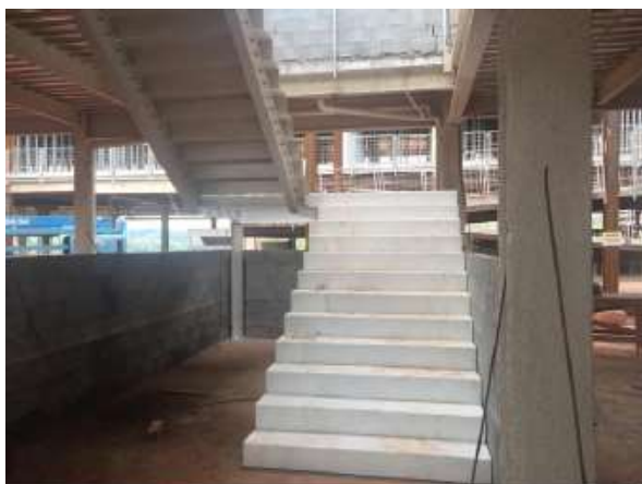
Montagem das escadas em estrutura metálica

O relatório fotográfico contendo as principais modificações na obra no mês de Dezembro de 2018: