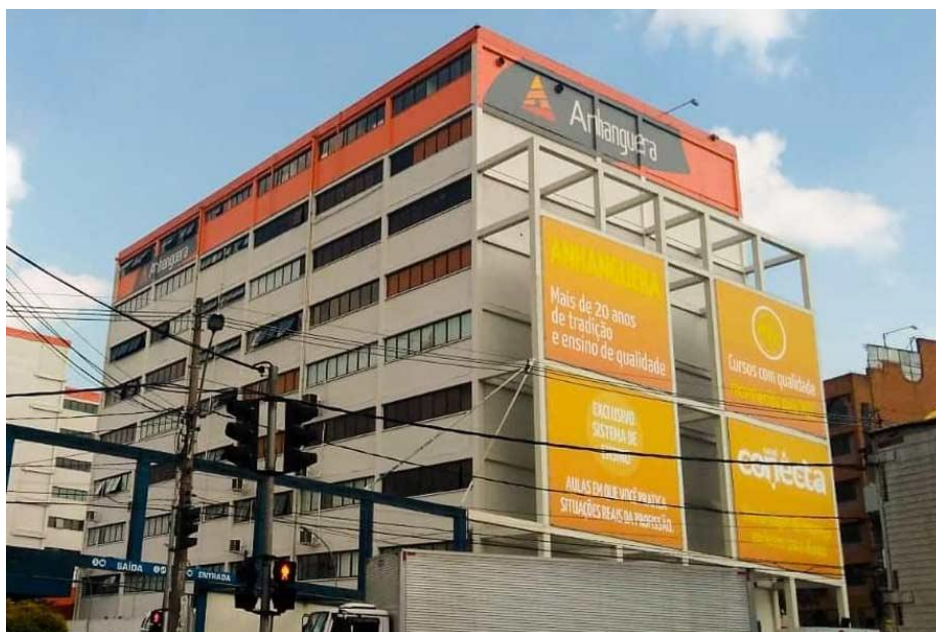
Taboão da Serra