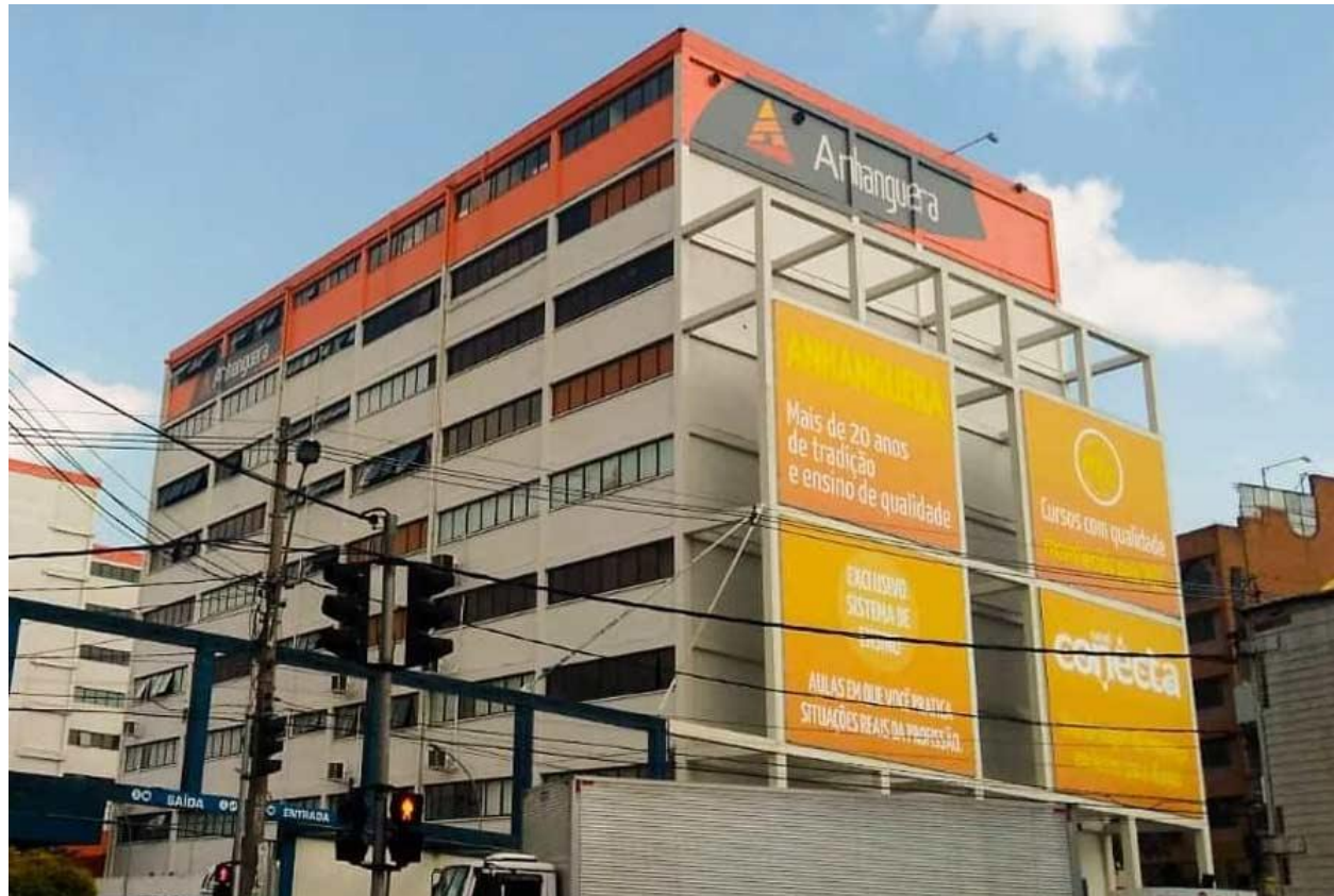
Taboão da Serra