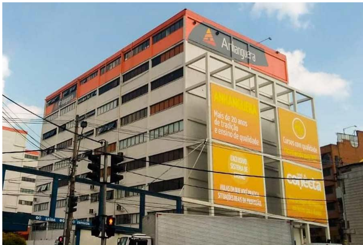
Taboão da Serra