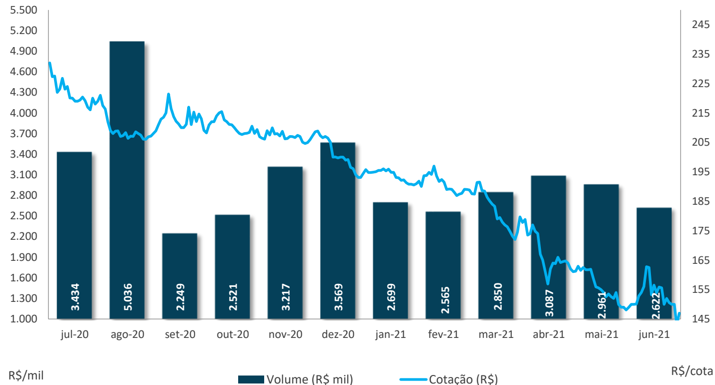
Evolução da cota no mercado secundário nos últimos 12 meses