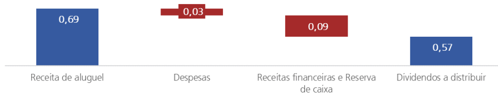
Gráfico de composição dos dividendos anunciados [em R$ por cota]: