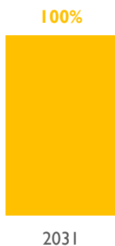
Permanência Garantida por ABL