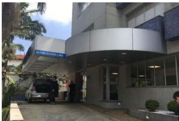
Acesso ao Hospital