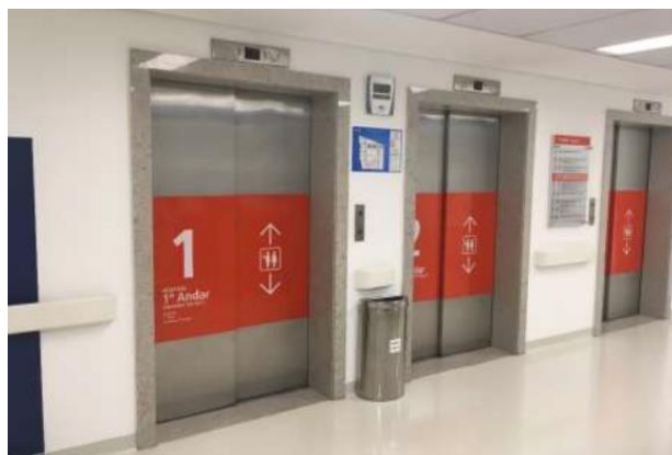
Hall dos Elevadores