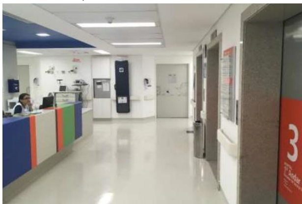
Área interna do Hospital