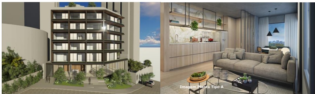
Imagens preliminares, sujeitas a alterações, do projeto Pádua Sales

Com a Transação, o Fundo passa a ter 84% do seu capital total comprometido em 11 (onze) projetos residenciais de médio-alto e alto padrão na cidade de São Paulo, contando com um portfólio diversificado de ativos.