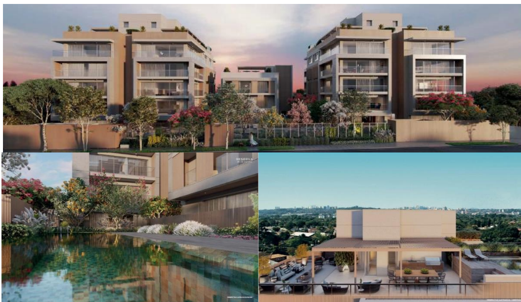
Imagens do projeto Reserva Alto de Pinheiros

Em decorrência da Transação, o Fundo será proprietário de unidades no projeto Reserva Alto de Pinheiros, as quais serão imediatamente oferecidas no mercado, e de unidades no projeto Pádua Sales, as quais serão negociadas a partir do lançamento do referido projeto.