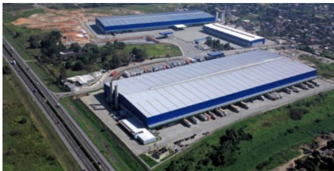
Caxias Park, Duque de Caxias - RJ

O Fundo assinou, no dia 27 de novembro de 2024, um novo contrato de locação referente ao ativo Caxias Park (“Ativo”), localizado no município de Duque de Caxias, Estado do Rio de Janeiro, o que levou o empreendimento a 100% de ocupação. A locação corresponde a 6 módulos do galpão G1, soma 4.881 m 2 de ABL, possui vencimento em abril de 2031 e foi assinada com uma empresa do setor de varejo que está expandindo suas operações no empreendimento.