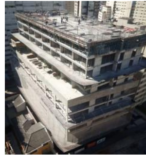
Foto Estrutura da Obra