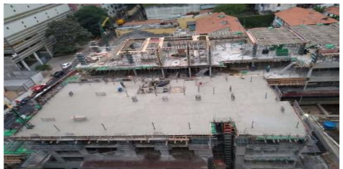
Foto Estrutura da Obra