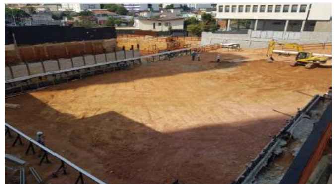
Foto da Escavação da Obra