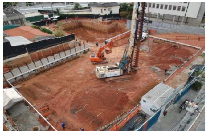
Foto da Escavação da Obra