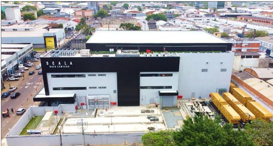
Imóvel Scala: vista da fachada e do entorno do Imóvel.

A construção do Data Center empregou a abordagem FastDeploy, metodologia proprietária de design da Scala que permite a implementação do data center em um prazo até 50% menor em relação ao modelo tradicional. Esta solução se baseia em componentes modulares pré-fabricados e transportáveis, que são integrados aos edifícios onde o data center se encontra, com arquitetura otimizada e personalizada para clientes Hyperscale .