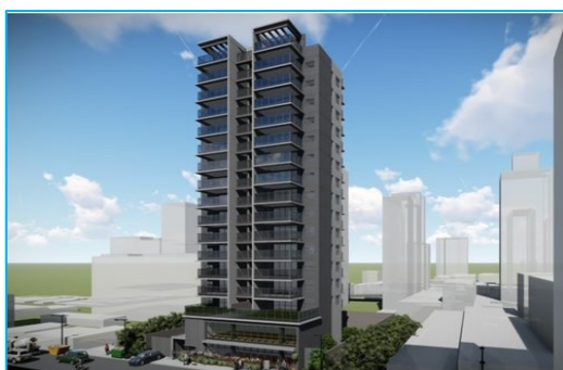
Perspectiva preliminar da fachada.

O projeto consistirá em empreendimento residencial de alto padrão com 30 apartamentos de 149,80 m 2 privativos cada e uma loja de 500 m 2 privativos. O investimento total pelo Fundo será de até R$ 17.549.000,00 (dezessete milhões, quinhentos e quarenta e nove mil reais), o que representa 13,82% do capital total do Fundo.