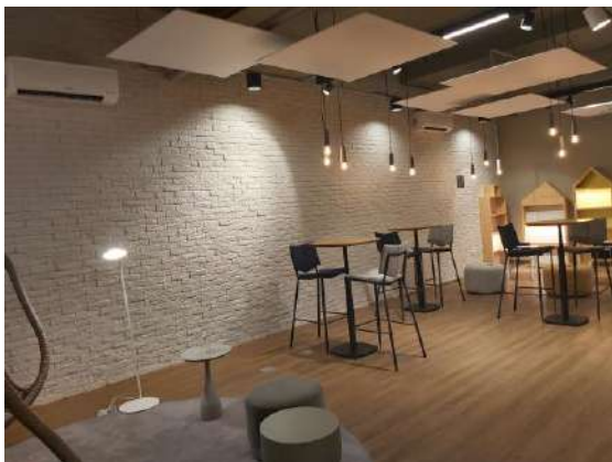
Características Internas do Imóvel Avaliando.