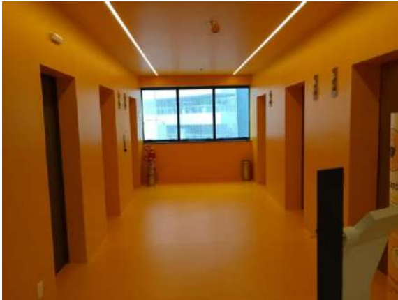
Características Internas do Imóvel Avaliando.