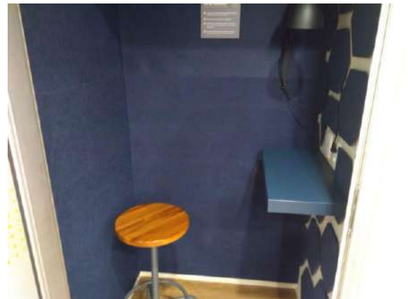
Características Internas do Imóvel Avaliando.