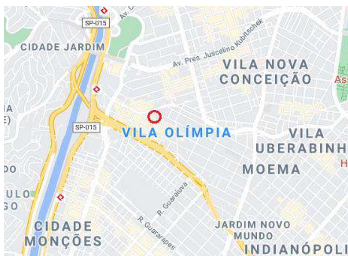
Croqui de Localização.

São Paulo - SP Av. Paulista, 1.159 - 7º Andar - Conjunto. 713 - Jardim Paulista CEP: 01311-921 - PABX/FAX: (11) 5904- 7572 contato@amaraldavila.com.br