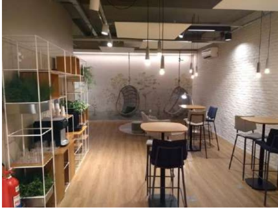
Características Internas do Imóvel Avaliando.