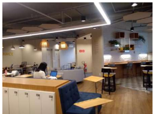
Características Internas do Imóvel Avaliando.