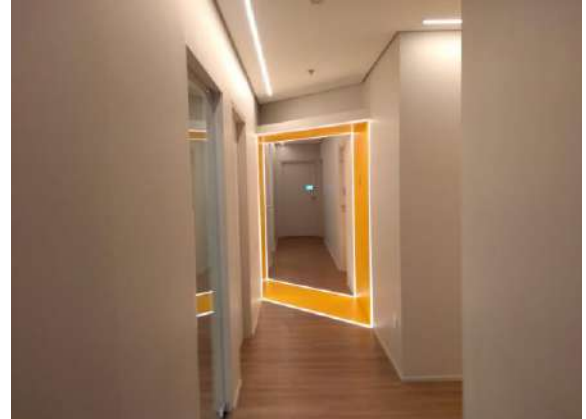
Características Internas do Imóvel Avaliando.