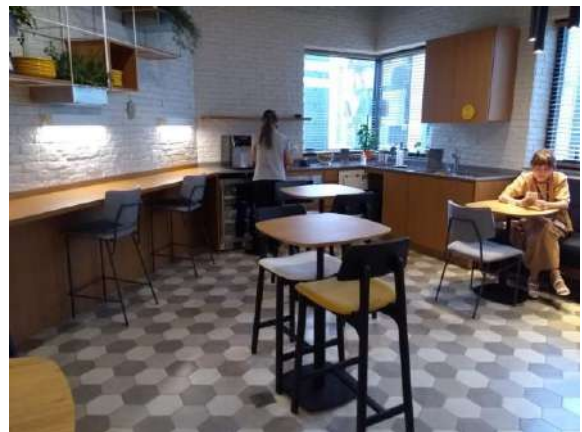
Características Internas do Imóvel Avaliando.