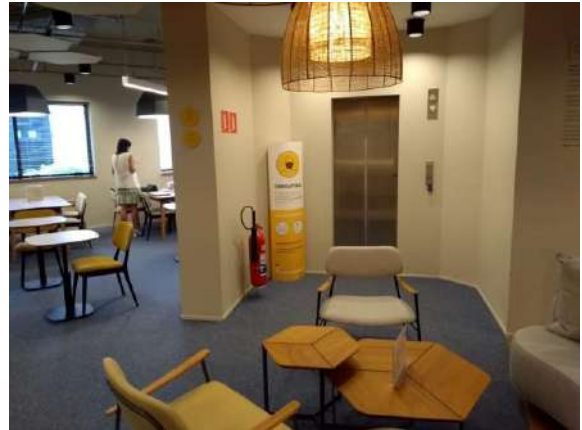
Características Internas do Imóvel Avaliando.