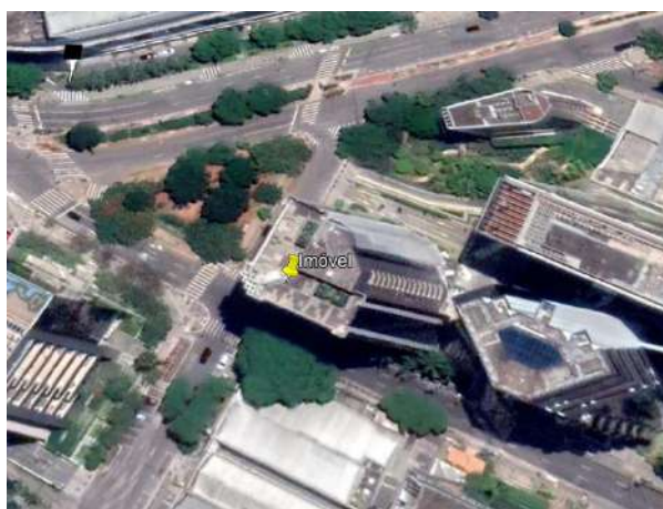
Vista Aérea do Imóvel Avaliando.