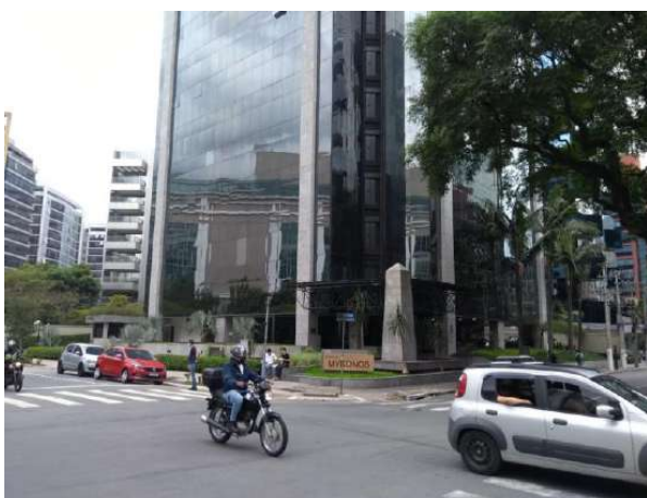
Vista Externa do Imóvel Avaliando - Alameda Vicente Pinzon.