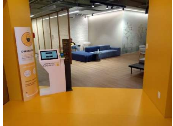
Características Internas do Imóvel Avaliando.