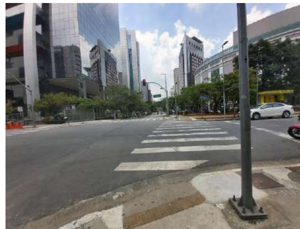
Rua Gomes de Carvalho - Local do Imóvel Avaliando.