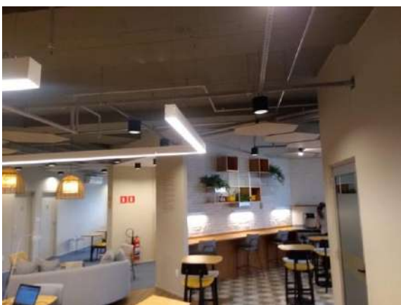
Características Internas do Imóvel Avaliando.