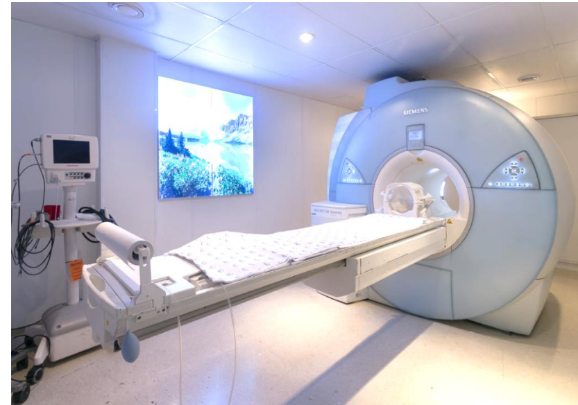
Centro de Diagnóstico