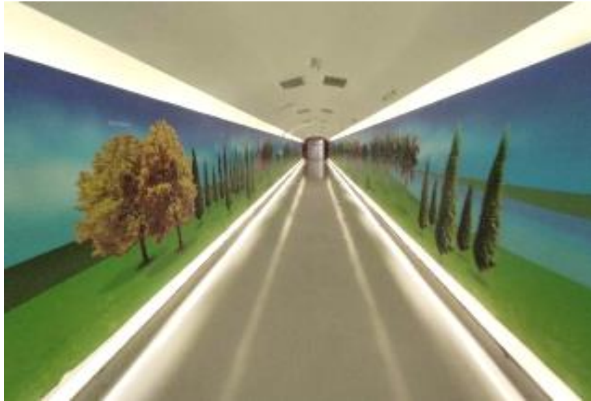
Interligação ao Hospital da Criança 1