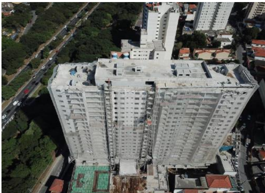
Foto Vista Geral Obra