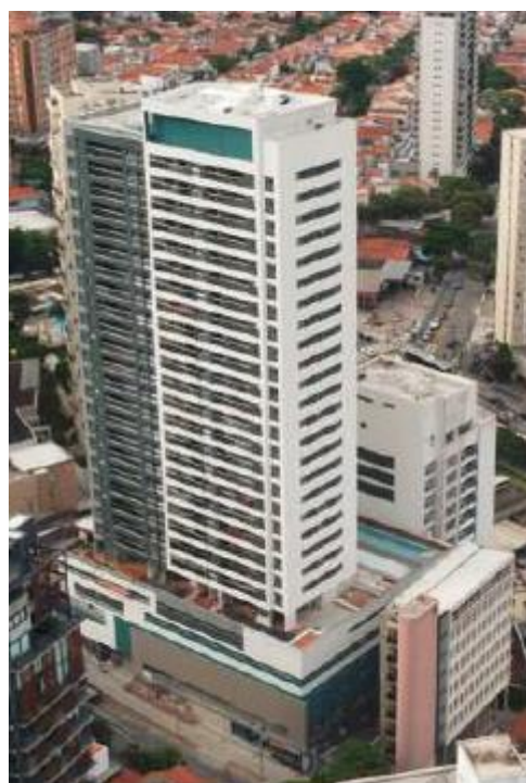
Foto Fachada da Obra - Misce