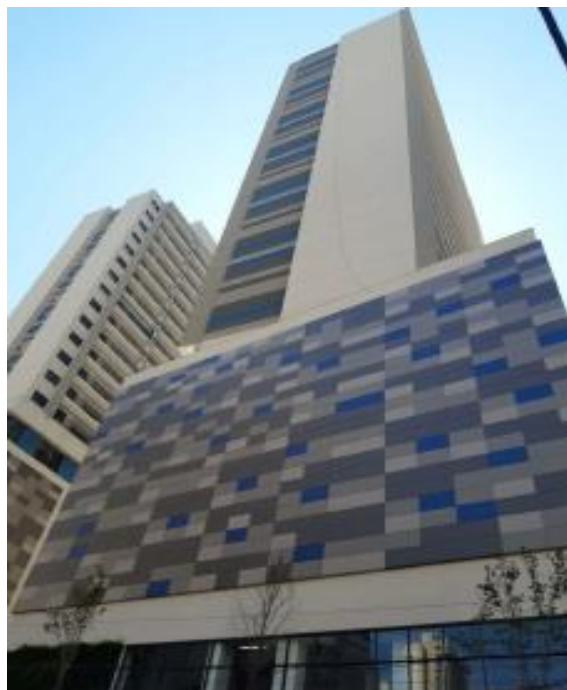
Foto Fachada da Obra - Facto