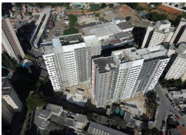
Foto Estrutura Obra