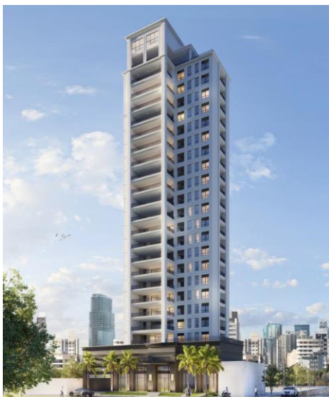
Perspectiva artística da fachada do projeto Guarará (imagem meramente ilustrativa). Projeto Pascal ainda em aprovação.

três mil reais), correspondente a 14,24% do capital total subscrito pelos cotistas. Da mesma forma, visando diversificação de riscos do portfólio, os membros do Comitê de Investimentos aprovaram ainda a cessão futura de até 50% do valor comprometido total no referido projeto ao veículo Brio IV;