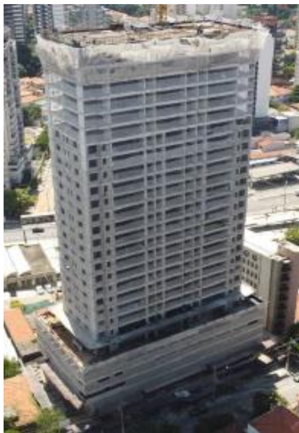
Foto Estrutura da Obra - Misce