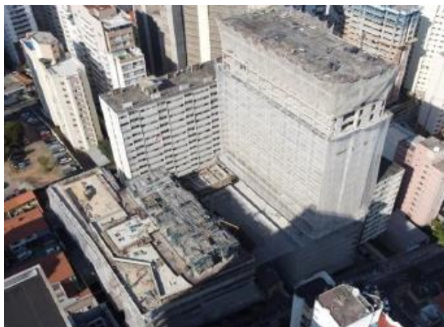
Foto Estrutura da Obra