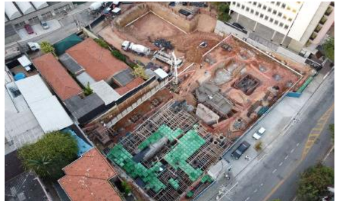
Foto da Escavação da Obra