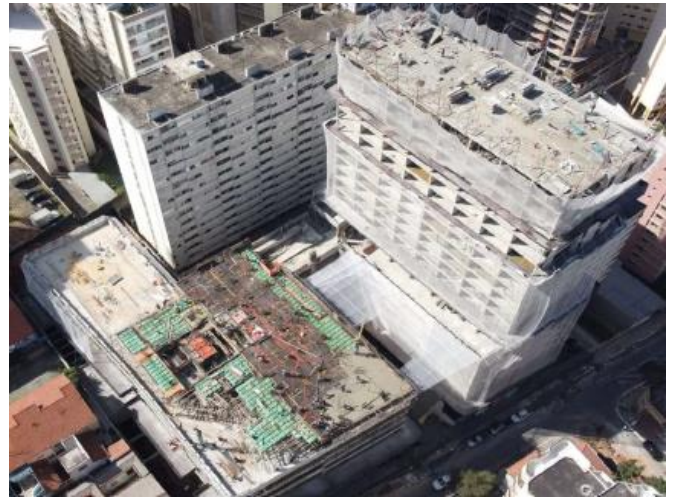
Foto Estrutura da Obra