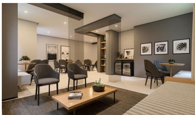
Perspectiva Salão de Festas