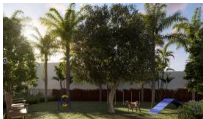
Perspectiva Pet Place