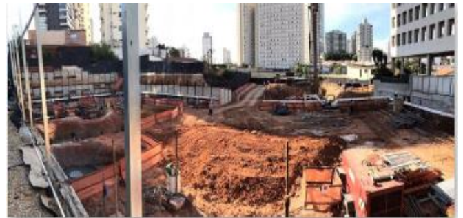
Foto da Escavação da Obra