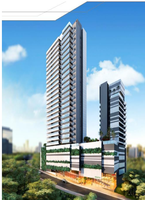
Perspectiva Fachada - Misce