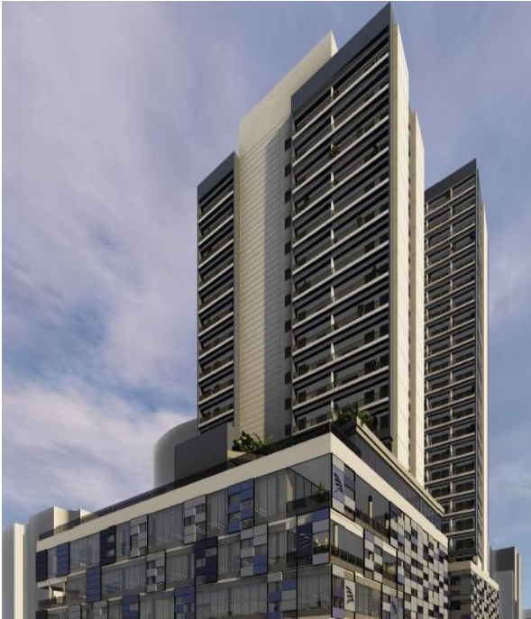
Perspectiva fachada - Facto