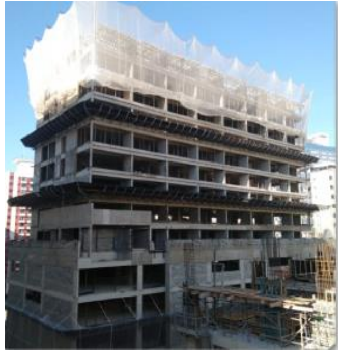
Foto Estrutura da Obra