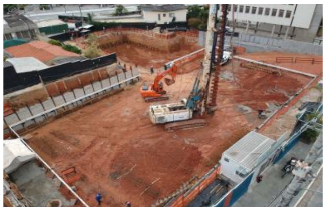
Foto da Escavação da Obra