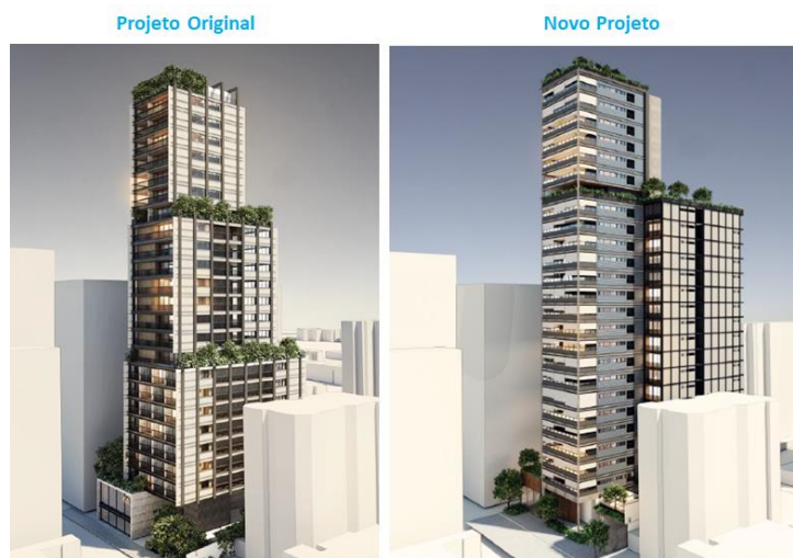
Imagens meramente ilustrativas. Perspectivas da fachada do empreendimento.

Com a Transação, o Fundo passa a ter 53,0% do seu capital total comprometido em 7 (sete) projetos residenciais de médio-alto e alto padrão na cidade de São Paulo: