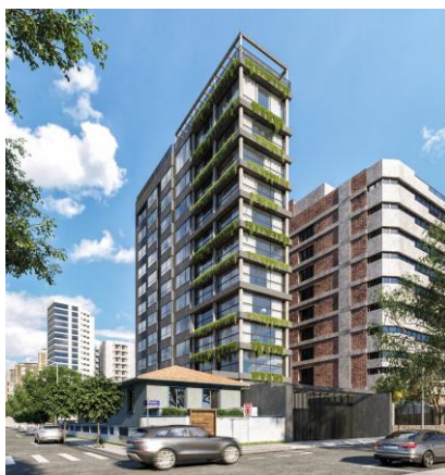
Imagem preliminar do projeto, sujeita a alterações.

Em decorrência da Transação, o Fundo fará jus ao recebimento de permuta física no referido projeto, que se destaca pelo produto diferenciado de altíssimo padrão, preço competitivo e valorizada e exclusiva localização.